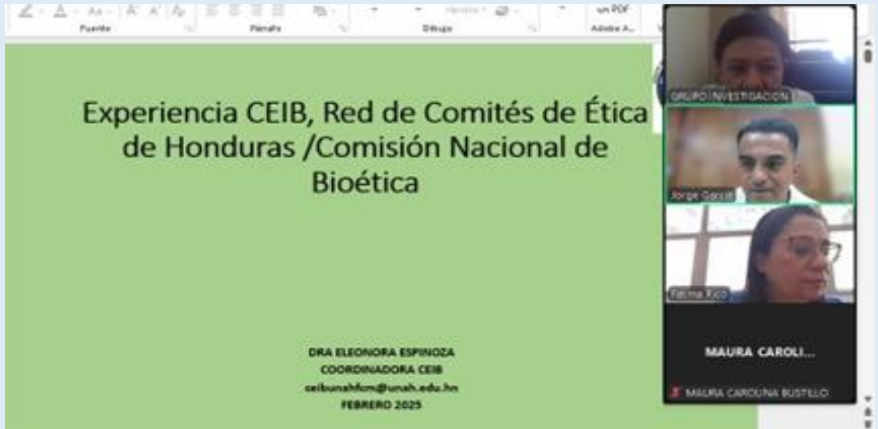
Comité de Ética del Hospital Escuela , 13 de febrero 2025.