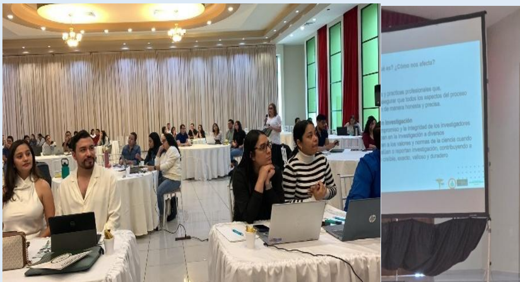
Ética de la Investigación y Publicación Científica. Colegio Médico de Honduras, sábado 22 de febrero