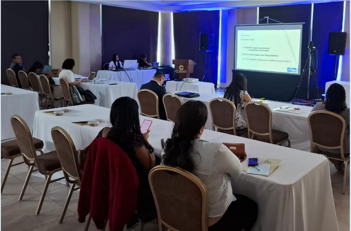
COMENAC 2025, Pre congreso San Pedro Sula. 09 de julio de 2025

Debe evitarse llevar a cabo experimentos con nuevas terapias en aquellos pacientes que normalmente no podrían pagar el tratamiento Debe documentarse si se le ha dado adecuada información al paciente y si su consentimiento ha sido obtenido ( y si no fue así, cual ha sido el motivo)