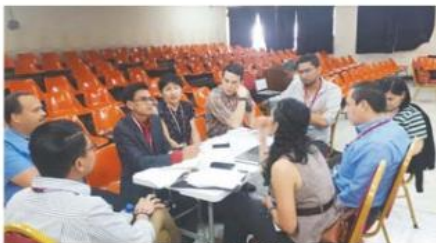
Grupo de trabajo.

Creemos que Honduras debe contar con espacios de análisis y reflexión desde una perspectiva bioética, así como el fortalecimiento de la ética de la investigación, la CNB contribuirá a conformar una masa crítica de expertos y profesionales versados que bajo los principios éticos de la investigación y la Declaración Universal sobre Bioética y Derechos Humanos apoyen a los investigadores, tomadores de decisiones y población en general, a dar respuesta a los dilemas bioéticos del mundo actual.