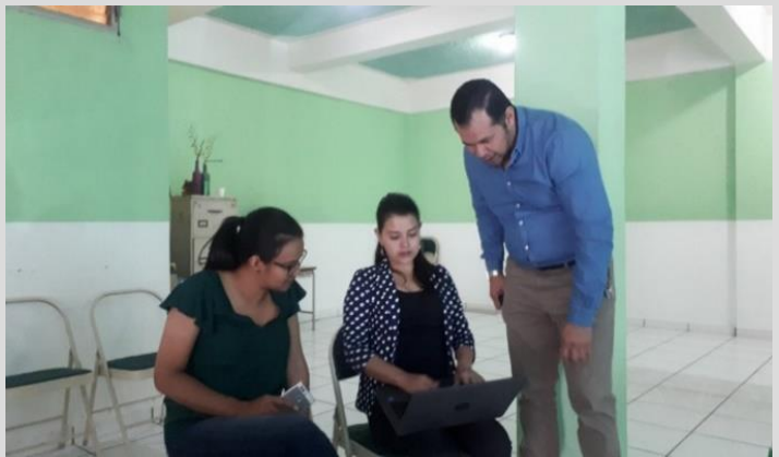
Capacitando en ProEthos y Ética en Santa Rosa de Copan