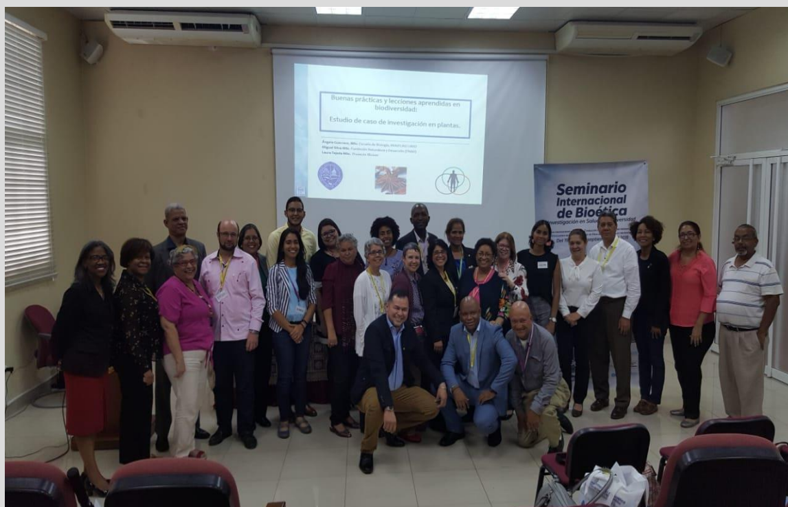
Participantes al evento