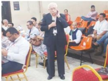
Grupo de trabajo Dr. Ramón Custodio excomisionado nacional de los Derechos Humanos de Honduras.