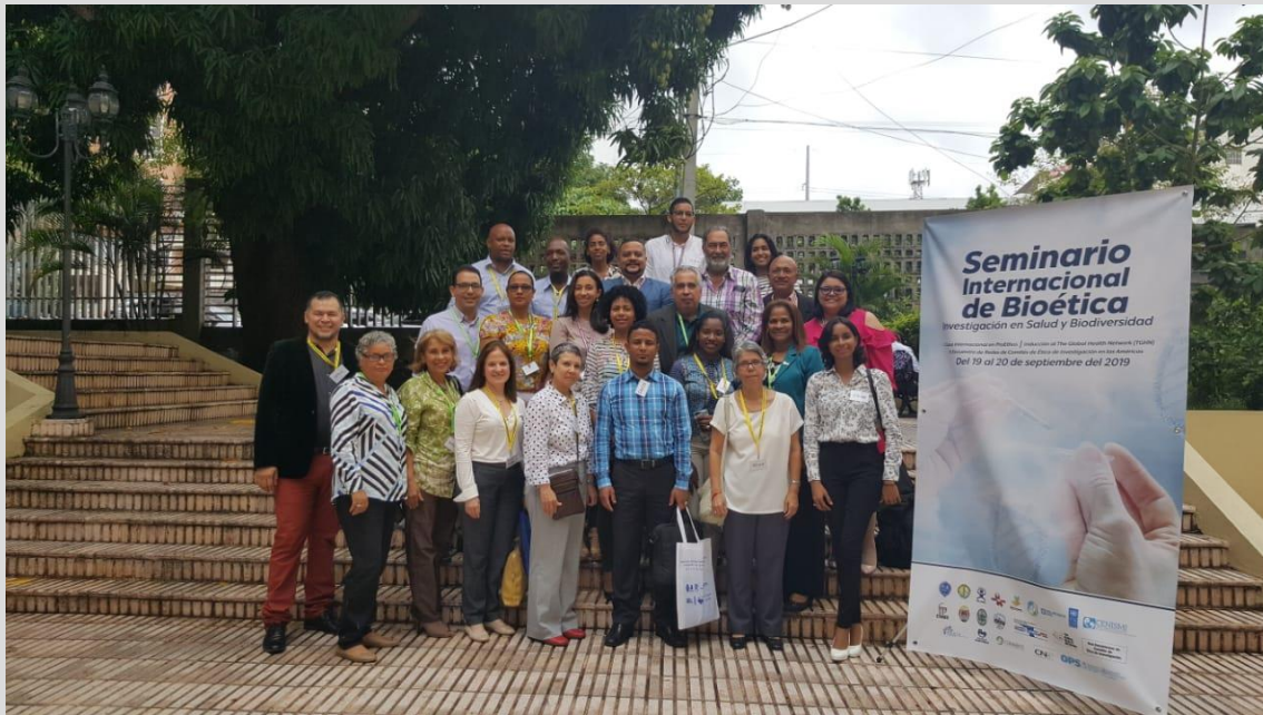
Participantes al evento