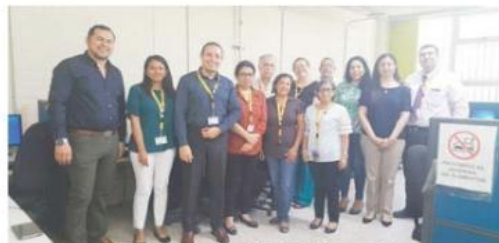
Socializando la iniciativa de la creación del CNB Universidad Valle de Sula.