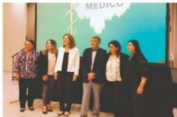
Foro sobre Ética y Bioética en el Colegio Médico de Honduras.