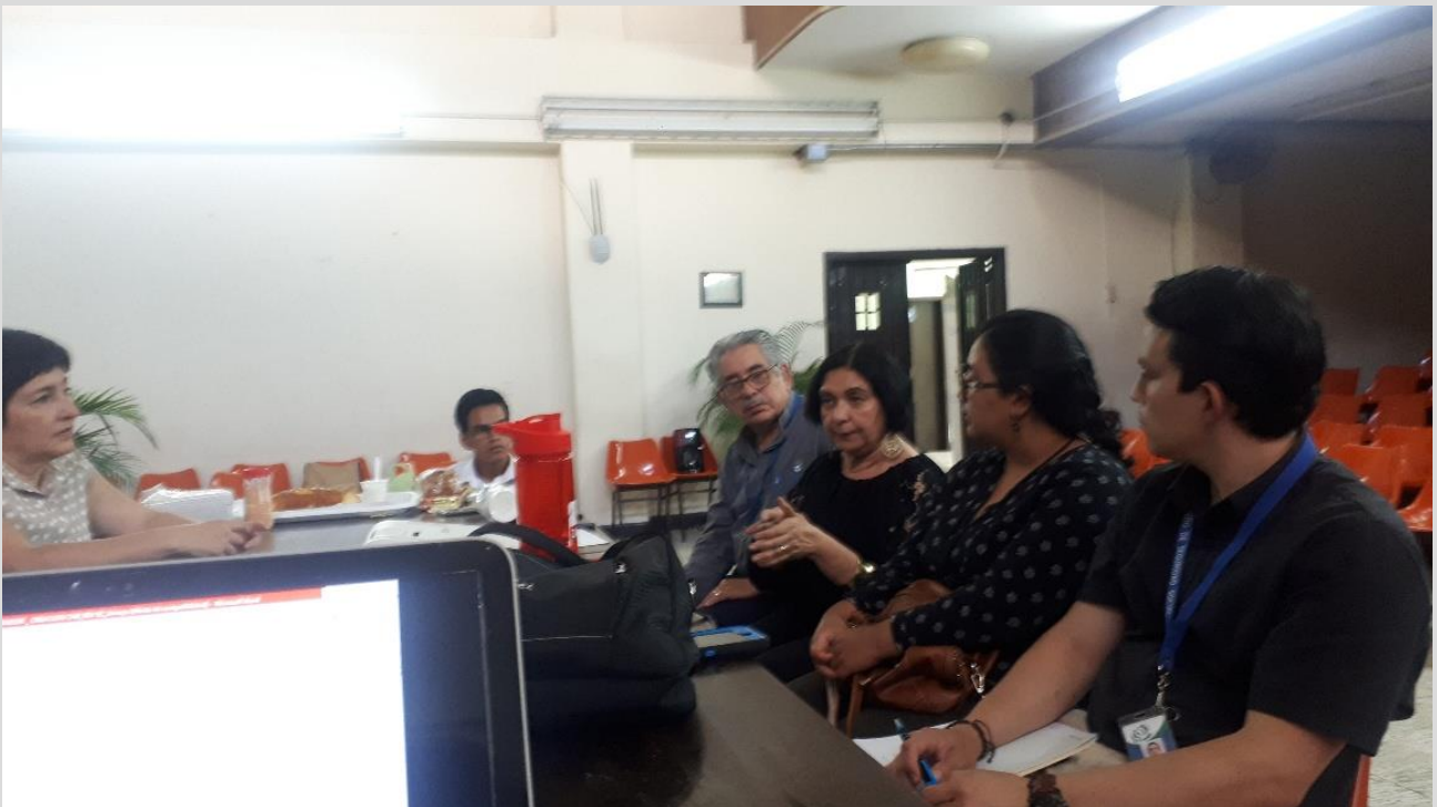
Grupos de Trabajo CNB-Honduras