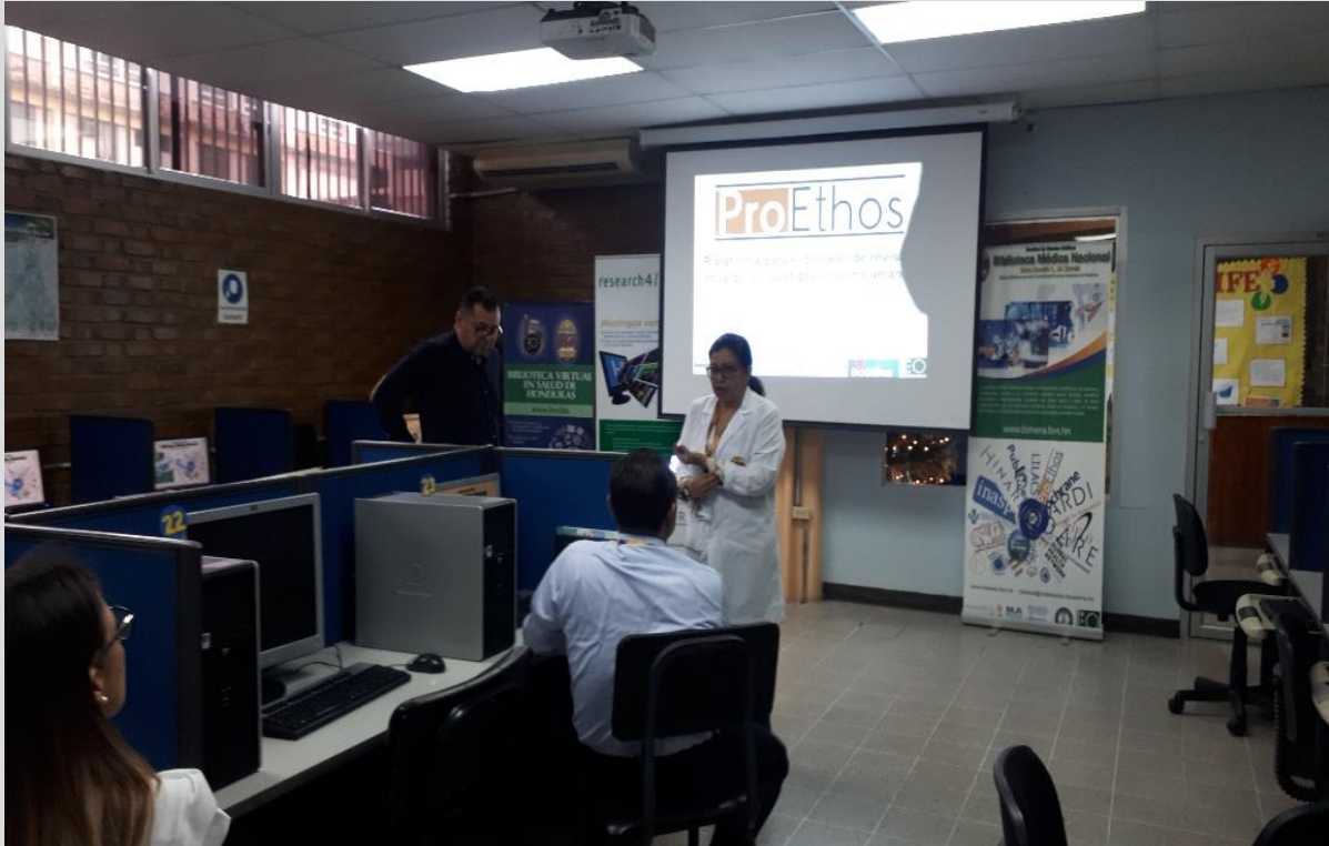
Capacitando en ProEthos Miembros RedCEIH