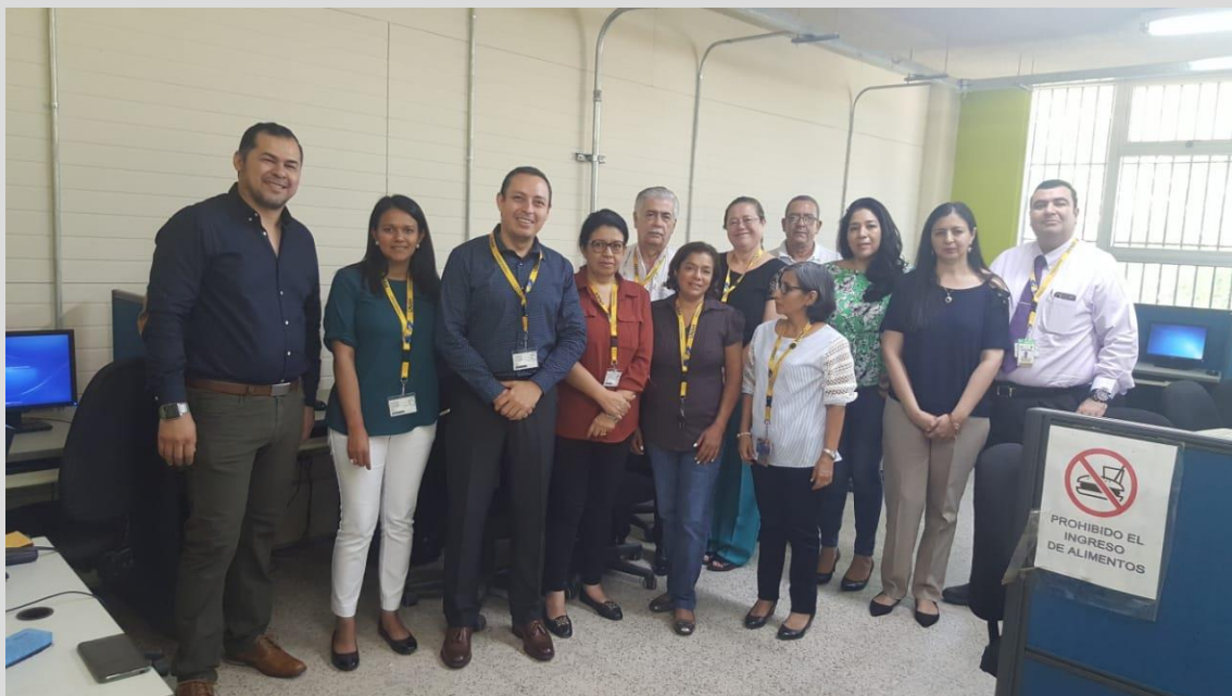
Capacitando a Miembros de los Comités de Ética en Investigación de San Pedro Sula

Dentro de las líneas de trabajo del CEIB, se continúa capacitando en ProEthos, como una alternativa de revisión en línea de los protocolos de investigación, es así que se llevó a cabo una jornada para introducir la versión N. 2. dirigido a los Investigadores de los Comités de Ética en Investigación de San Pedro Sula y Santa Rosa de Copán.