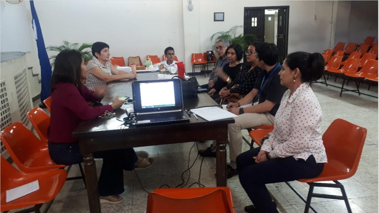
Grupos de Trabajo CNB-Honduras