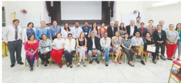
Participantes al I Taller de Creación del Comité Nacional de Bioética de Honduras.